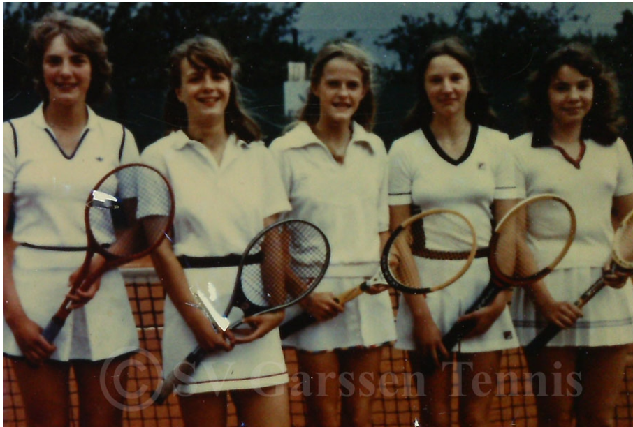
Bezirksmeister Juniorinnen B 1980