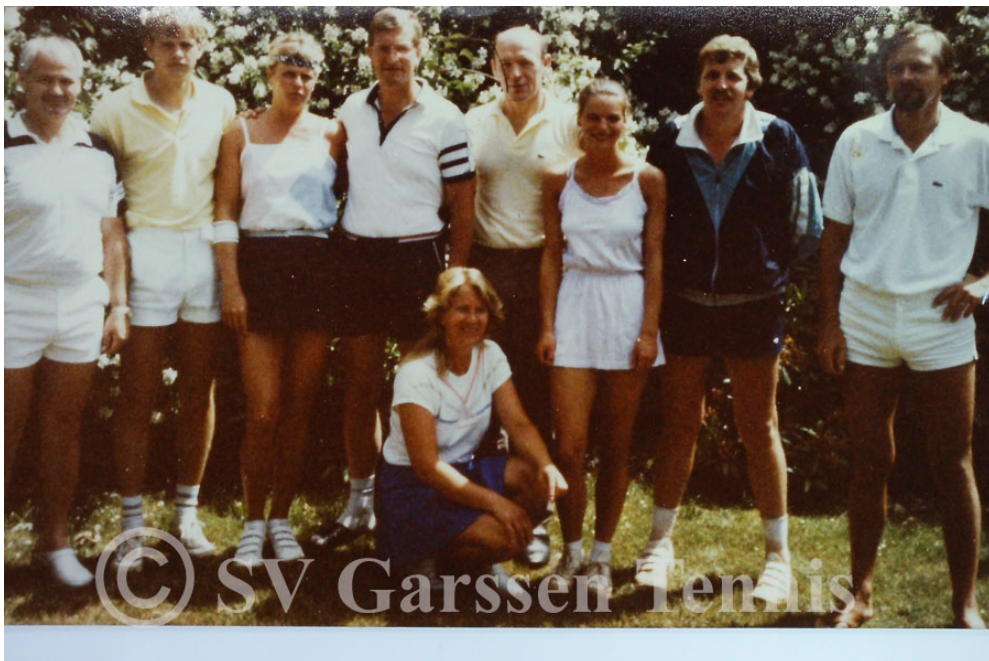
Später als Kreismeistermannschaft

Danach wechselten wir in den Punktspielbetrieb auf Bezirks- und Verbandsebene, wo es nur eigene Herren- und Damenmannschaften gibt. Zum besseren Verständnis des Folgenden muss ich erwähnen, dass es in diesem Bereich folgende Ebenen gibt: Kreisklasse, Kreisliga, Bezirksklasse, Bezirksliga, Verbandsklasse, Verbandsliga und darüber auf Landesebene noch die Landesliga.