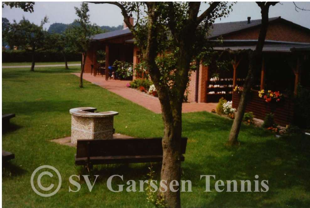
Grill vor Tennisheim

und schon knapp zwei Jahre nach der Einweihung des Sanitärtraktes konnte bei der Saisonöffnung am 2. Mai 1987 das fertige Tennisheim in Anwesenheit zahlreicher Ehrengäste eingeweiht werden.