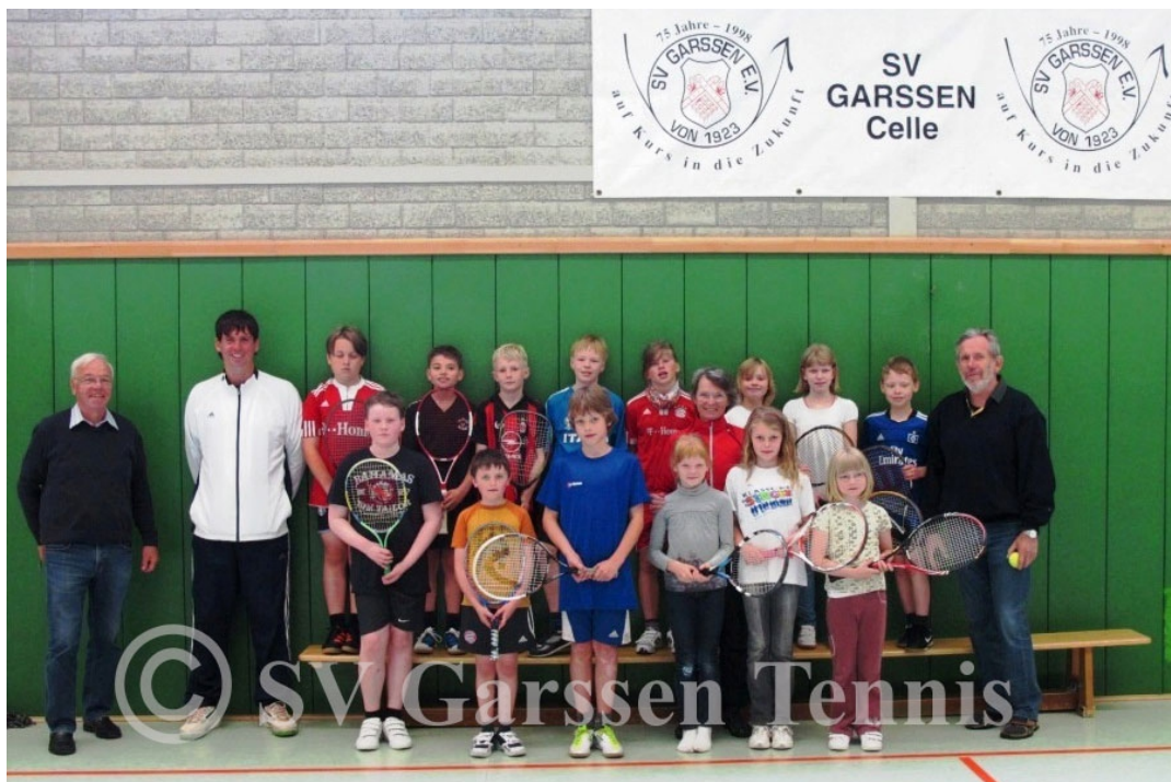
Kooperation mit GS Garßen