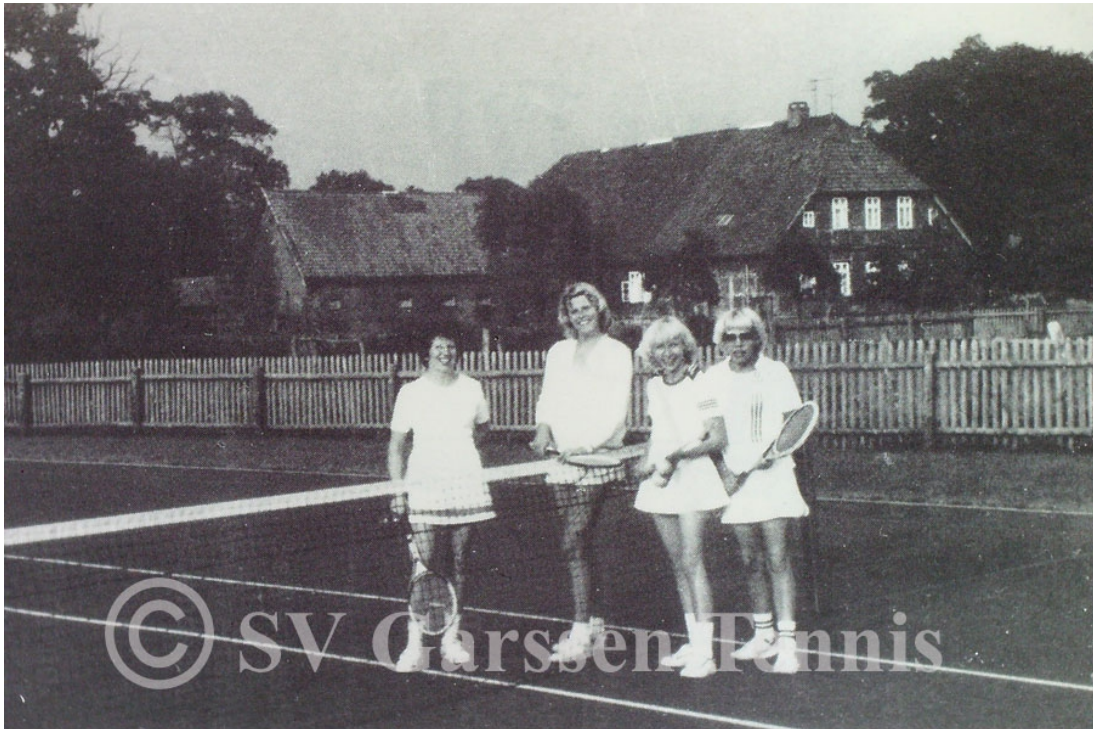
Tennisplatz hinter der Sporthalle

Von Anfang an war es klar, dass die zunächst nur sehr geringen Spielmöglichkeiten nicht ausreichten: In der neuen Garßener Sporthalle, die in erster Linie von der Schule und mehreren anderen Abteilungen des SV Garßen belegt wurde, standen pro Woche nur wenige Stunden zur Verfügung. Und der Kleinfeldspielfeldplatz hinter der Halle war vorwiegend für die Schule angelegt worden.