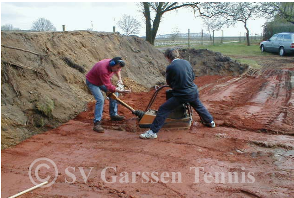
Bodenvorbereitung für Kleinfeldplatz

Da ich gerade wieder bei Baumaßnahmen bin, noch zwei Ergänzungen: