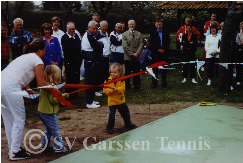
Einweihung Kleinfeldplatz und mit ihrer Unterstützung eingeweiht.

Im Jahr 2004 wurde dann noch – wieder unter dem Bauführer Kornetka – die Terrasse vor dem Tennisheim gepflastert.