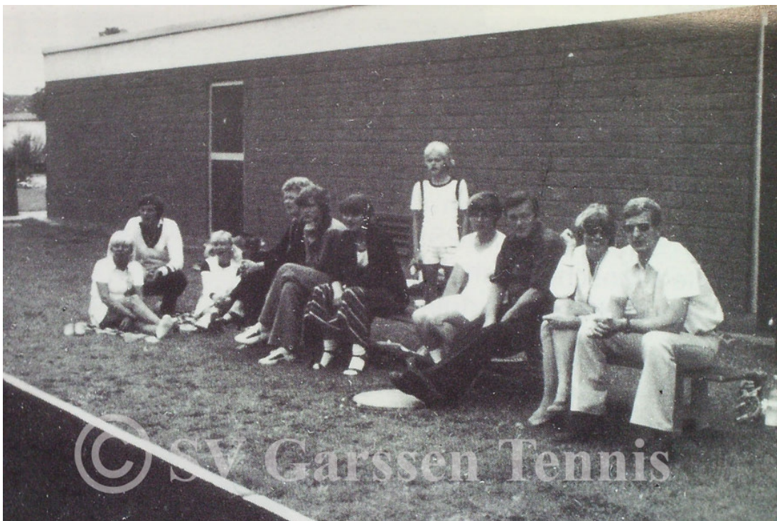
Zuschauergruppe: Tennisplatz hinter der Sporthalle