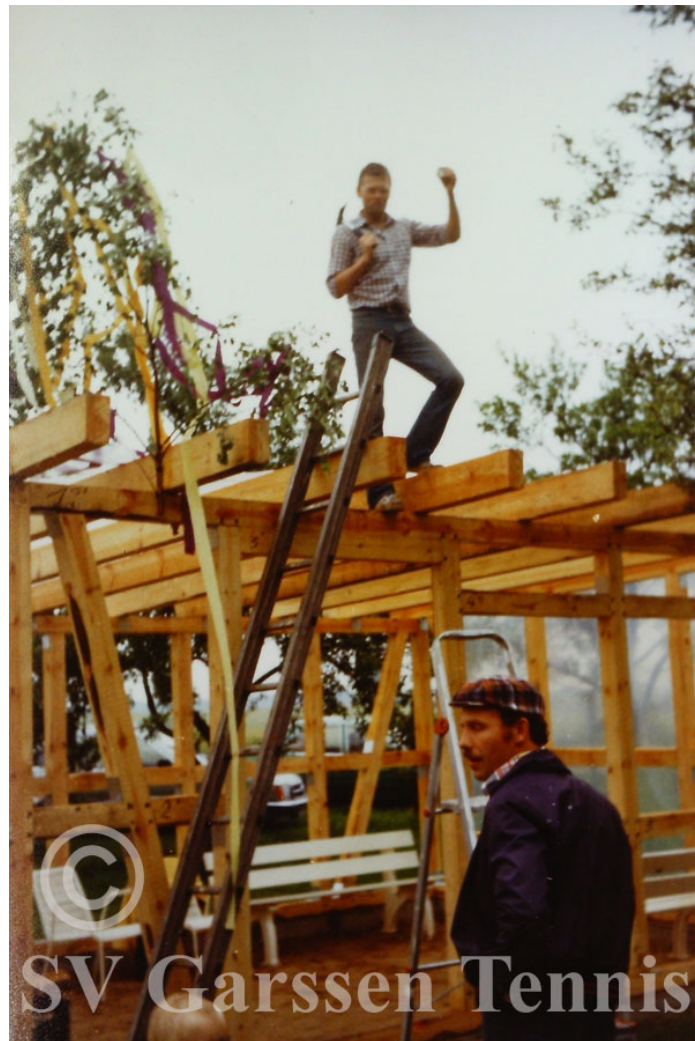
Rohbau der Holzhütte