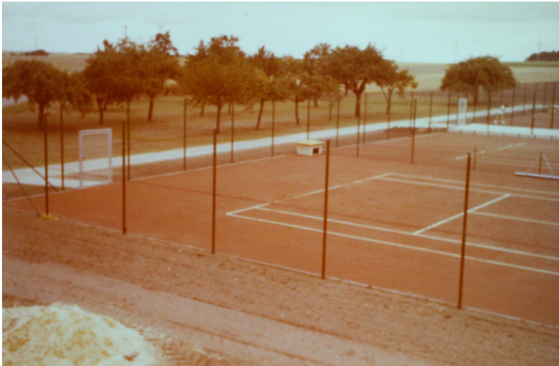
Die neuen Plätze