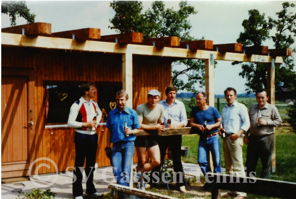
Helfer vor Hütte:

Zwei weitere Jahre später wurde noch eine überdachte Veranda angebaut.